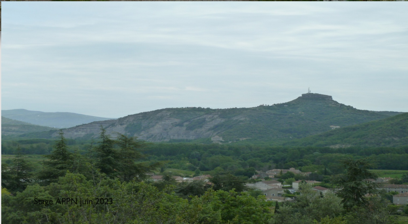
Stage ARPN juin 2023