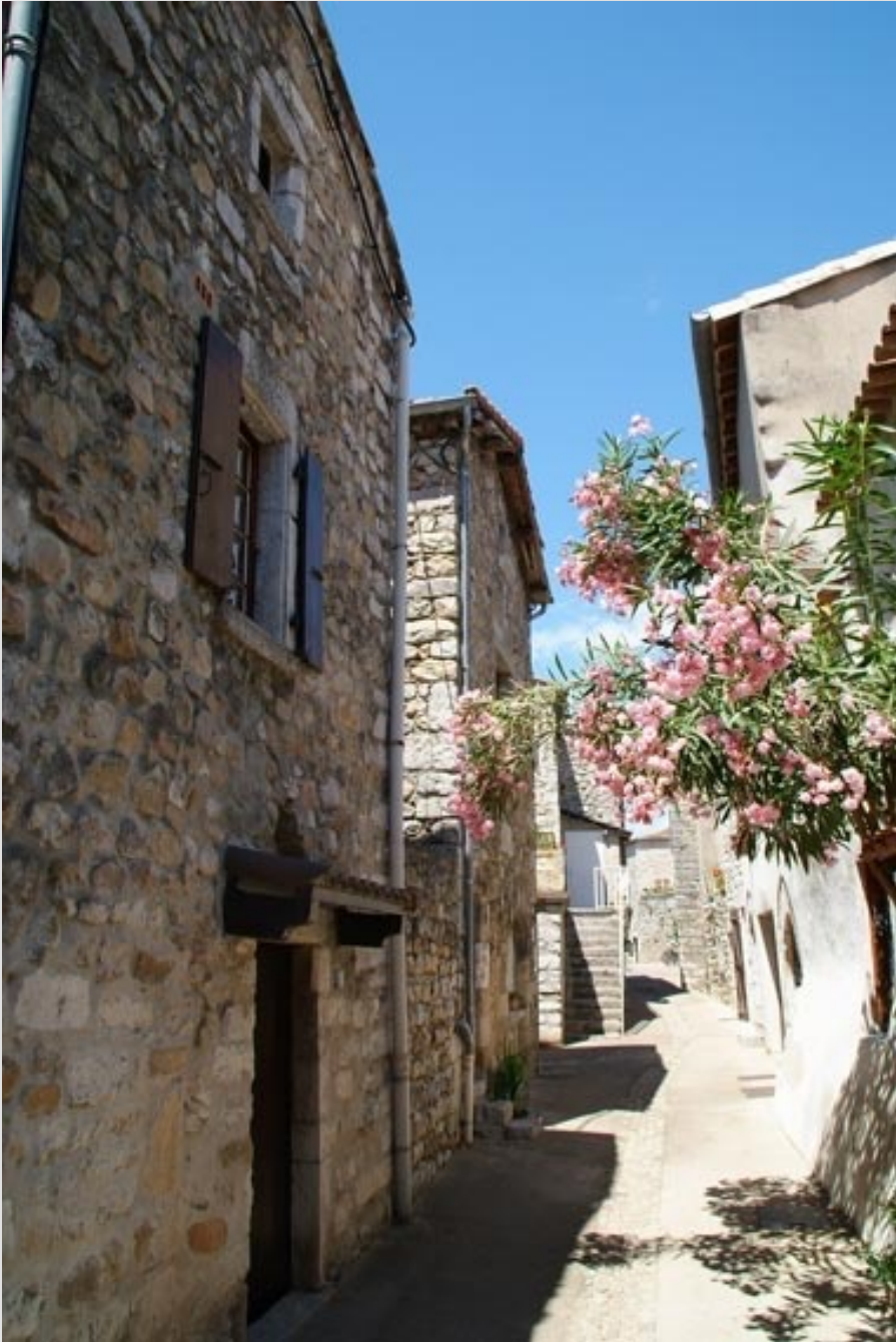
Stage APPN juin 2023