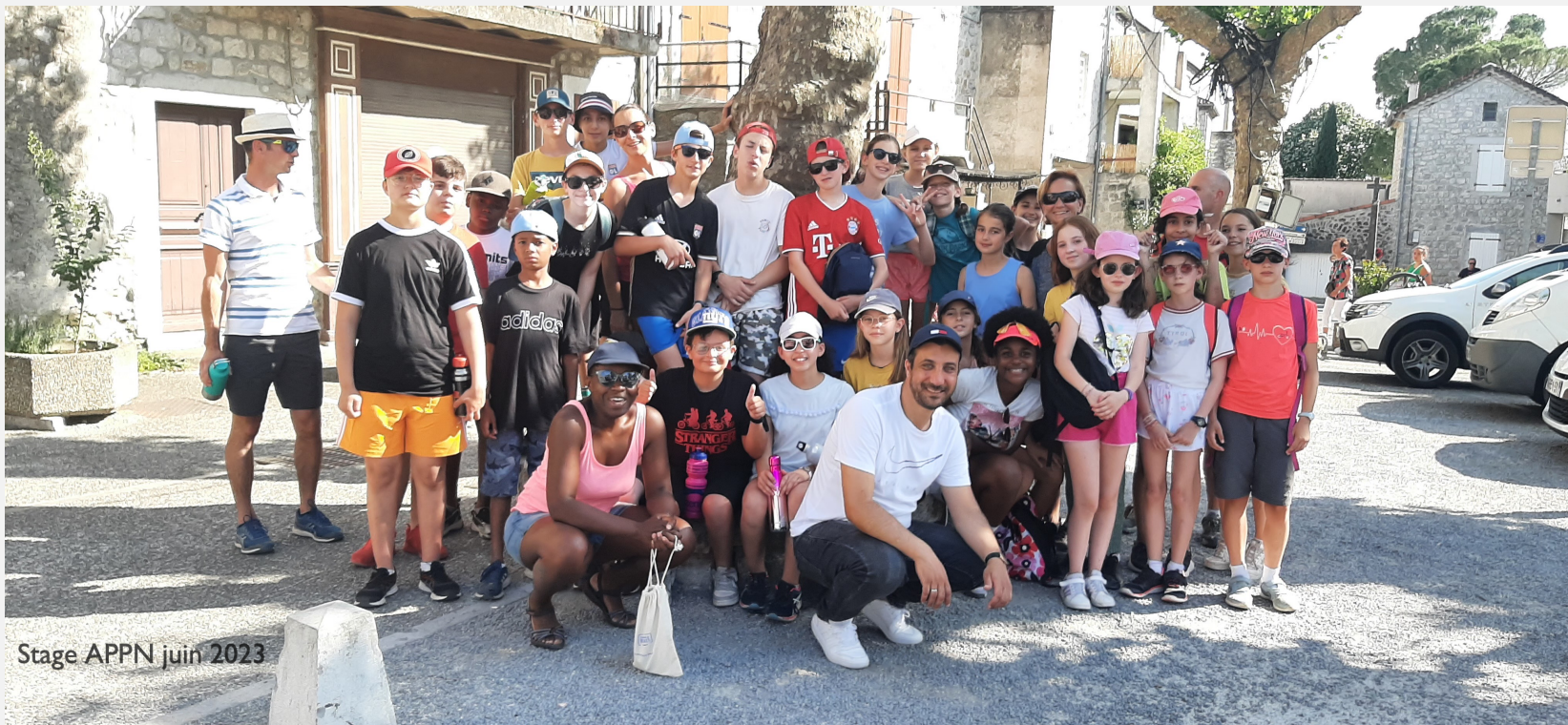
Stage APPN juin 2023